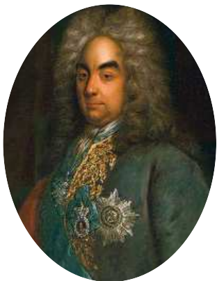
Петр Андреевич Толстой