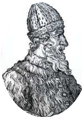
Великий князь Иван III

До XVIII века чиновники на Руси жили благодаря так называемым «кормлениям», то есть, при отсутствии оклада за исправление должности, разрешению на подношения от заинтересованных в их деятельности лиц. Одаривали их не только деньгами, но и «натурой» — мясом, рыбой, пирогами и пр., что было делом обыкновенным.