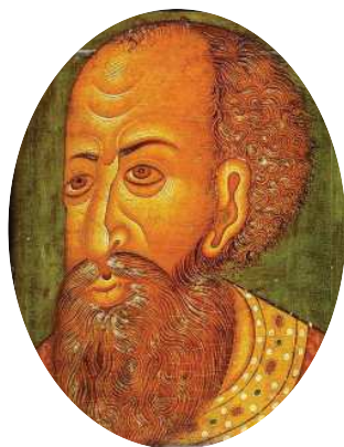
Царь Иван IV Грозный