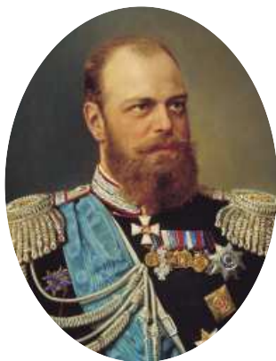
Император Александр III