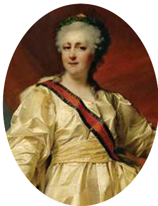
Императрица Екатерина II

В одном из циркуляров Наркомюста 1927 года предписывалось «в течение месяца повсеместно и одновременно назначить к слушанию по возможности исключительно дела о взяточничестве, оповестив об этом в газете, дабы создать по всей республике впечатление