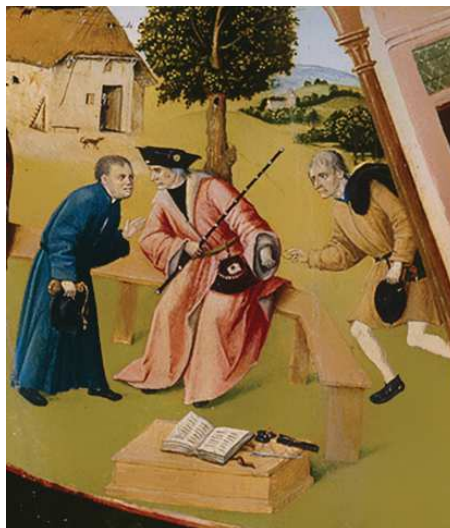
Фрагмент «Алчность» картины Иеронима Босха «Семь смертных грехов»

Рассматривая участников коррупции на примере взяточничества, стоит отметить, что в коррупционном процессе всегда участвуют две стороны. Одна сторона — это взяткополучатель (подкупаемый). Вторая сторона — это взяткодатель (осуществляющий подкуп). Также в процессе может участвовать и третья сторона — посредник.