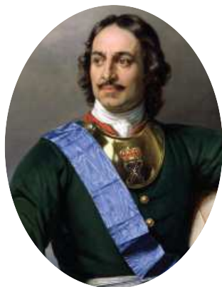
Император Петр I

Сообщениями «о похищении казны» первоначально занималась тайная канцелярия во главе с графом П.А. Толстым. И работала она на совесть. Но были и такие дворяне и чиновники, которые к проблеме мздоимства относились гораздо терпимее. По рассказам современников, однажды в Сенате Петр пригрозил издать указ, по которому всякий, кто украдет у казны сумму, на которую можно купить веревку, будет повешен. Генерал-прокурор Ягужинский на это заметил: «Неужели вы хотите остаться императором без служителей и подданных? Мы все воруют — с тем только различием, что один больше и приметнее, чем другой».