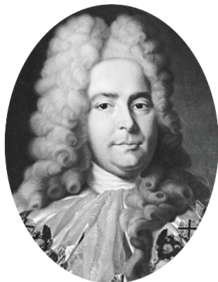
Генерал-прокурор Павел Иванович Ягужинский